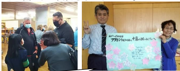
後日、訪問団から中藤小学校の子どもたちへのメッセージをお届けしました

中藤小学校を訪問した際には、とっても元気な子どもたちに囲まれて交流を楽しみました。