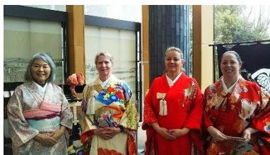
郷土歴史博物館での着物体験

訪問団27名は、福井市美術館での浮世絵展見学や永平寺での座禅体験、養浩館でのお茶席や東郷地区での餅つき、越前和紙の里での紙漉き体験など、様々な日本文化を堪能しました。